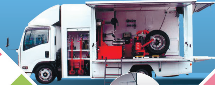
出張タイヤ サービスカー

これからも、お客様視点で独創性ある「一歩進んだ」製品開発をつづけ、 感謝の気持ちを忘れることなく、長く愛される100年企業を目指してまいります。