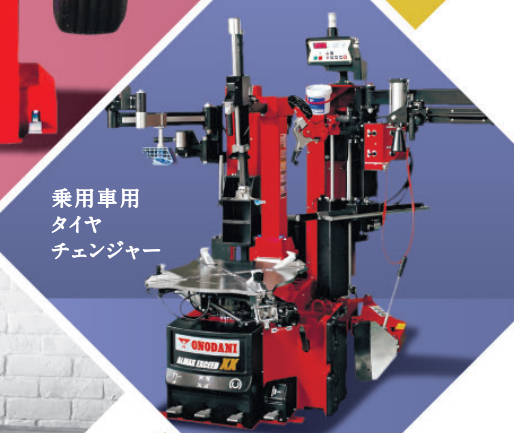
乗用車用 自動 タイヤ チェンジャー