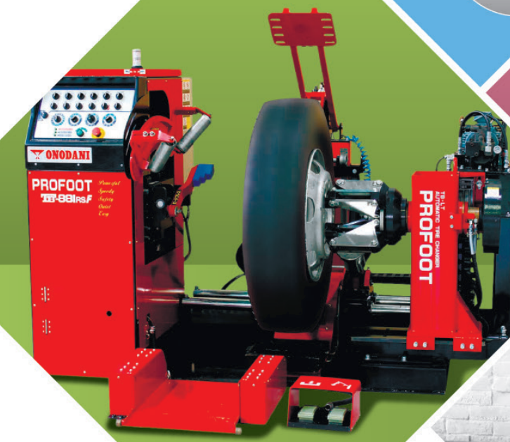
大型車用 自動タイヤチェンジャー