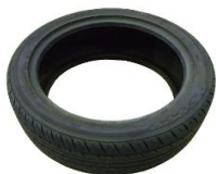
トレッド部分割後