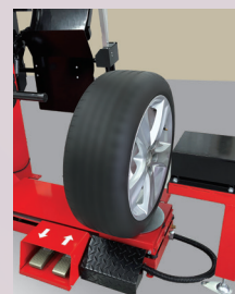
終了後にリフトを下降し タイヤの取り出し