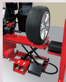
balancer に取付のため ターンテーブルでタイヤ ホイールの方向転換