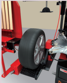
リフトにタイヤを乗せ