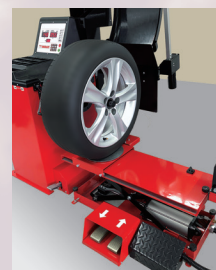
リフトの昇降ならびにス ライドで balancer に セット