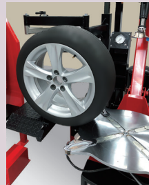
チェンジャーのテーブル 部へ移動