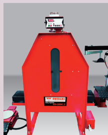
自動エア充填装置付きの ライン専用安全囲い