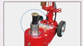
ジャッキ受け部の高さ微調整が可能