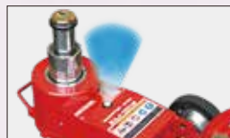
ジャッキポイントを明るく照射