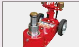
低床車等のジャッキアップに最適